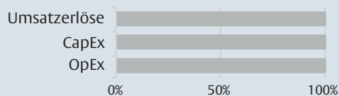
1. Taxonomiekonformität der Investitionen einschließlich Staatsanleihen*

Die nachstehenden Grafiken zeigen den Mindestprozentsatz der EU-taxonomiekonformen Investitionen in Grün. Da es keine geeignete Methode zur Bestimmung der Taxonomiekonformität von Staatsanleihen* gibt, zeigt die erste Grafik die Taxonomiekonformität in Bezug auf alle Investitionen des Finanzprodukts einschließlich der Staatsanleihen, während die zweite Grafik die Taxonomiekonformität nur in Bezug auf die Investitionen des Finanzprodukts zeigt, die keine Staatsanleihen umfassen.